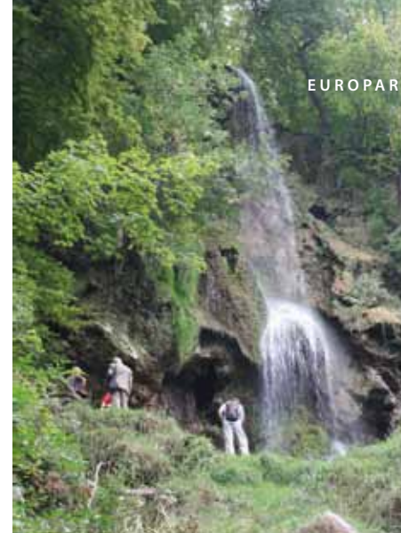
Wasserfall bei Bad Urach

ihrem Gelingen trugen auch die vielen freiwilligen Helfer bei. Die Tagung stand unter dem Motto „Qualität zählt, Gewinn für Mensch und Natur“ deren wichtigstes Ergebnis die Verabschiedung der Bad Urach - Deklaration zur Stärkung der Schutzgebiete in Europa war. Auch, wenn das Thema Ranger nicht in einem gesonderten Workshop präsentiert und behandelt wurde, betonten doch mehrere Referenten bei ihren Vorträgen, wie notwendig die Öffentlichkeitsarbeit und die personelle Ausstattung der Schutzgebiete,