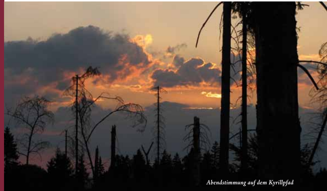
Abendstimmung auf dem Kyrillpfad

Die namentlich gekennzeichneten Beiträge der verschiedenen Autoren geben nicht unbedingt die Meinung der Redaktion bzw. des Bundesverbandes wieder!