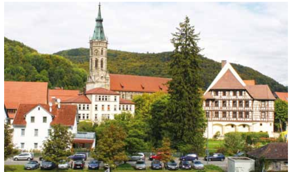
Blick auf Bad Urach

Robby Meißner Vorstand des Bundesverbandes Naturwacht e.V.