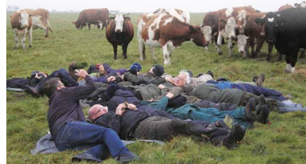
Ranger in Aktion

Einen ganzen Tag lang zeigte uns die Dänische Ranger Association anhand von verschiedenen Aktionen ihre Erfahrungen in Sachen Naturinterpretation und Umweltbildung. Angefangen vom Umgang mit Tierhandpuppen, bei dem man vor allem den Zugang zu kleineren Kindern findet und ihnen die Natur näher bringt, bis hin zu einer Smartphone App, die sich die Jugendlichen runterladen können und so Informationen über die Natur/Schutzgebiet erhalten. Da bei allen Veranstaltungen mit Kindern auch die „Action“ und Spannung in Sachen Natur Erfahrung nicht fehlen darf, gab es noch ein besonderes Experiment: Alle Ranger legten sich auf einer Kuhweide ganz eng zusammen, sodass die Füße nach außen zeigten und warteten bis die Kühe herankamen und an den Schuhen leckten. Dies