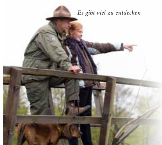
Es gibt viel zu entdecken