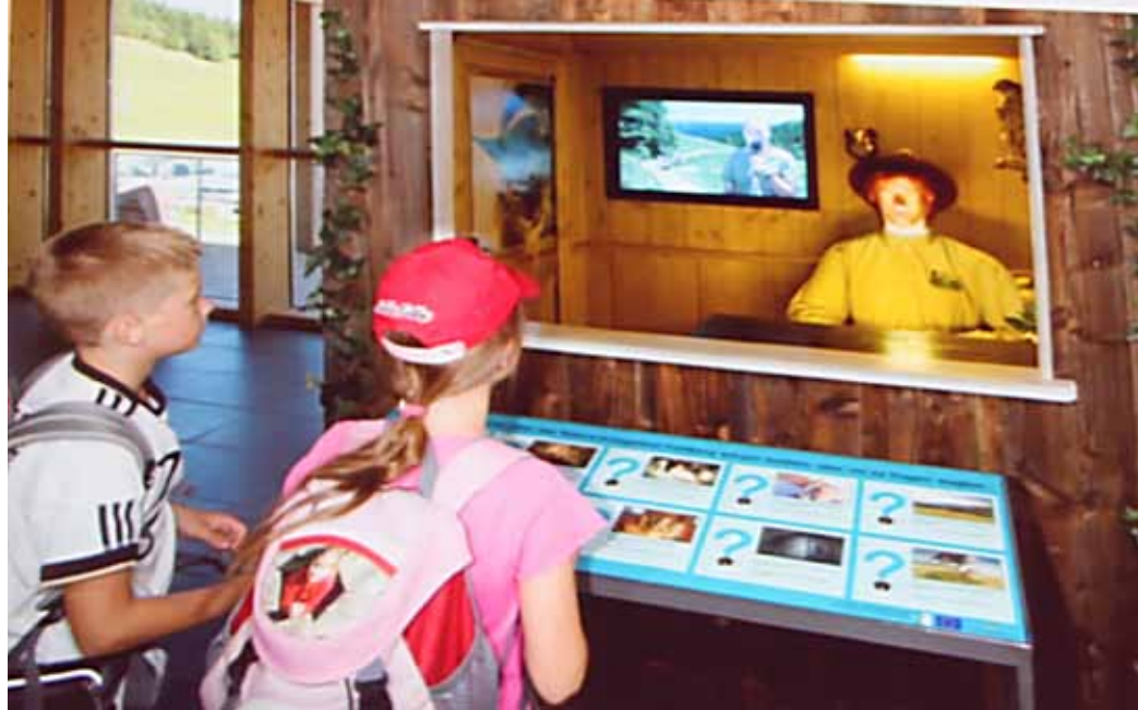
Die Rangerhütte im Haus der Natur gewann den Kommunikationspreis in der Kategorie „Einzelne Kommunikationsmaßnahme“.

Der „Talking Ranger“, war der Grund unseres Ausflugs. Er hat es einer sehr hochkarätig besetzten Jury aus Journalisten und Kommunikationsexperten angetan. Beim „Talking Ranger“ handelt es sich um einen künstlichen Doppelgänger, der in der Ausstellung im Haus der Natur am Feldberg sitzt und der auf Knopfdruck die häufigsten Fragen unserer Besucher beantwortet. „Warum dürfen Kühe auf die Wiese, Menschen aber nicht?“ – „Was sind die zwei häufigsten