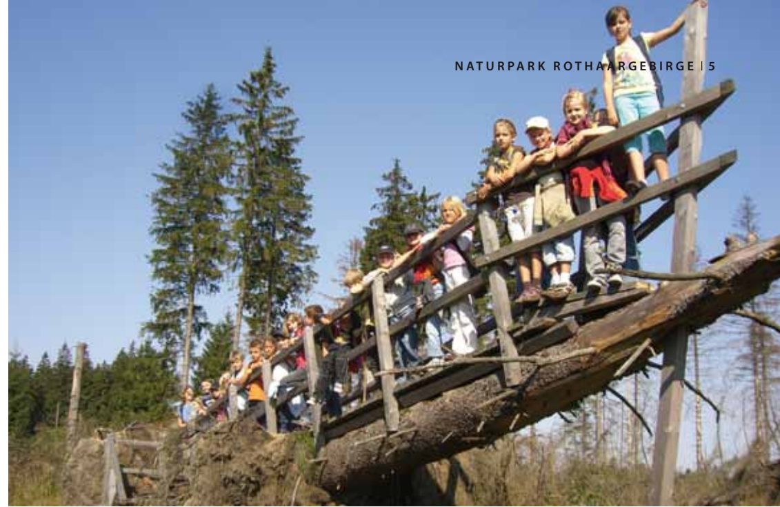
Auf der Titanic